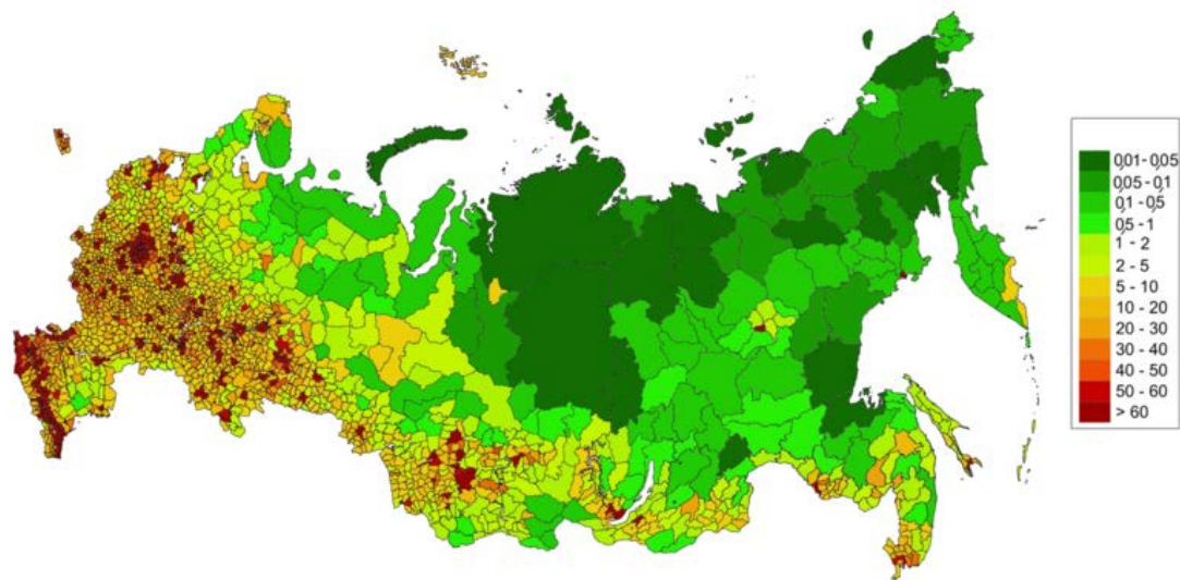
شکل ۴- تراکم جمعیتی در نواحل مختلف فدراسیون روسیه

در راستای تکمیل سیاست‌های جمعیتی، مبحث مهاجرپذیری به عنوان یکی از اصول اساسی در حال اجرا است. در گزارش منتشر شده در مرکز مطالعاتی «سولاشکین» ۹ ، تعداد جمعیت اقوام روس رو به کاهش است، اما این آمار توسط مهاجرین جبران می‌شود. به همین منظور هر زن خارجی که به صورت ازدواج قانونی و یا غیرقانونی از یک شهروند روسیه باردار شود و فرزند به دنیا آورد، شهروندی روسیه را کسب نموده و می‌تواند از خدمات دولتی برخوردار شود.