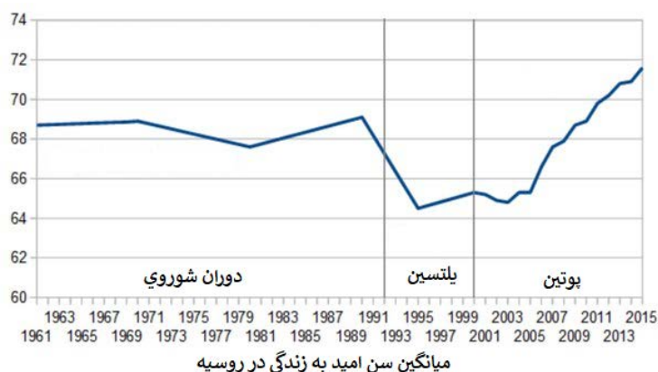
شکل ۳: نمودار سن امید به زندگی در روسیه

از جمله طرح‌های دولت روسیه تا سال ۲۰۲۵، تثبیت زاد و ولد متوسط سالیانه یک میلیون نوزاد و افزایش میانگین سن امید به زندگی نیز ۷۴ سال شود که براساس برخی آمارها اکنون ۷۱ سال است [پیوست ۲].