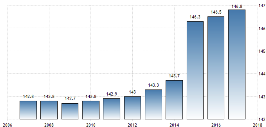
شکل ۲: جمعیت فدراسیون روسیه در ۱۰ سال اخیر ۴

پیدایش حفره جمعیتی، سیاست‌گذاران اجتماعی را به تکاپو و یافتن راه حل برای این بحران جدی واداشت. در نتیجه بروز این شوک جمعیتی، مجموعه سیاست‌های حمایت از افزایش جمعیت در این کشور تدوین و به اجرا درآمد. این سیاست‌ها به‌گونه‌ای کارآمد بود که از نظر آماری بعد از ۱۵ سال پیایی کاهش جمعیت در روسیه (نرخ رشد منفی)، از سال ۲۰۱۰، رشد جمعیت روند مثبت یافت و از ۱۴۲,۸۵۶,۵۳۶ نفر به جمعیت ۱۴۶,۸۰۴,۳۷۲ در ابتدای سال ۲۰۱۷ افزایش یافت. از لحاظ شاخص امید به زندگی نیز از سال ۲۰۰۶ تاکنون میانگین به ۶۶,۷ رسیده که مردان ۶۰,۶ سال و زنان ۷۳,۱ سال است.